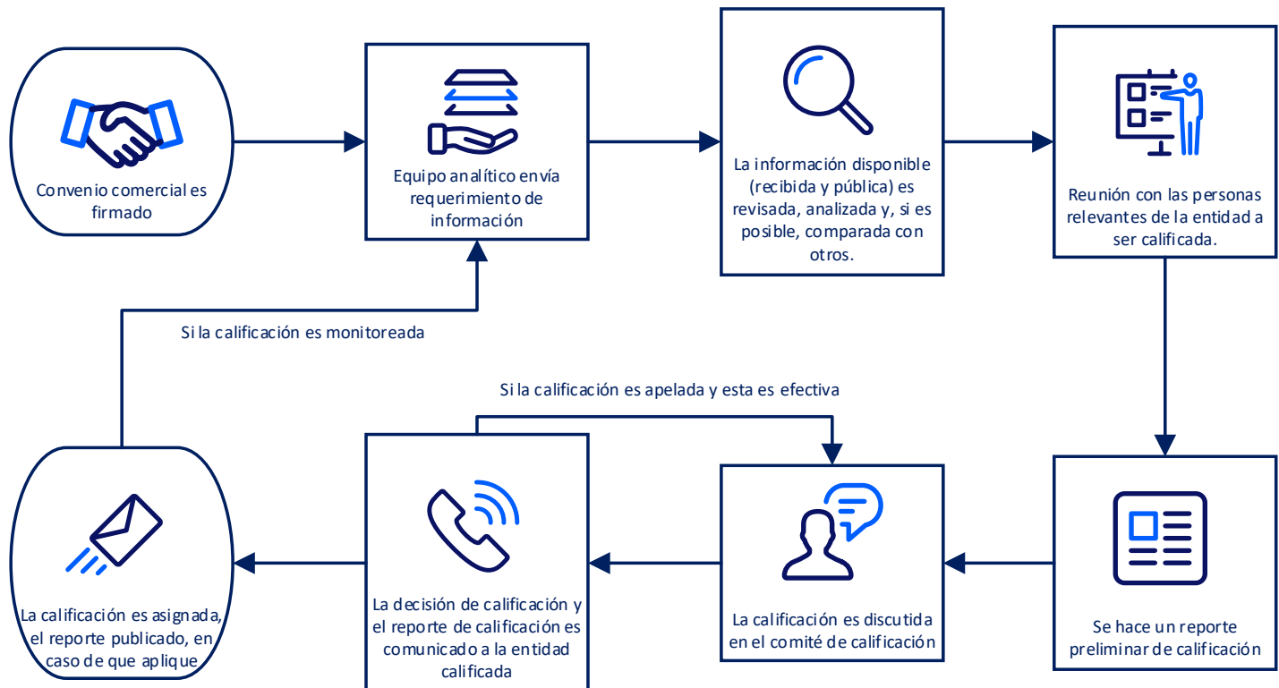
FIGURA 10 Representación gráfica del proceso de calificación

El proceso de calificación se divide en dos etapas diferentes: el proceso de calificación inicial y el proceso de supervisión de la calificación. En general, el proceso para ambas etapas se describe en el siguiente gráfico.